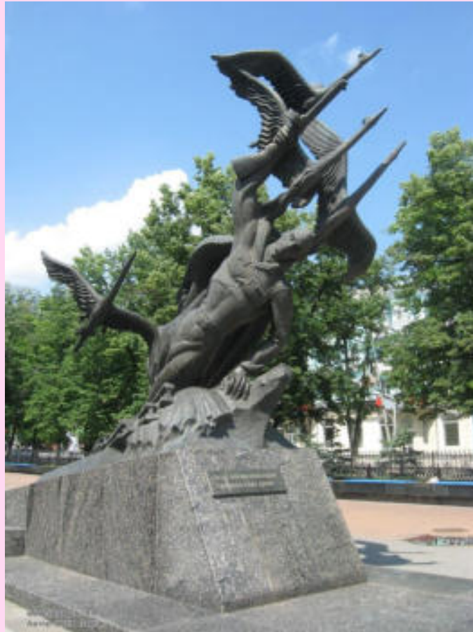
г. Луганск (Украина)