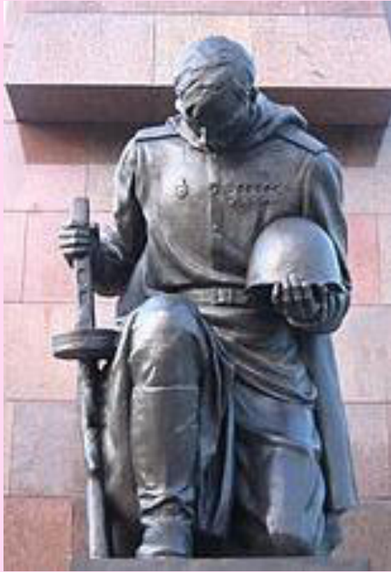
г. Берлин (Германия)