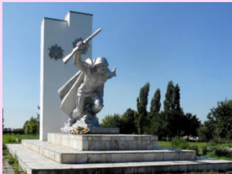
с. Воронежская (Краснодарский край)