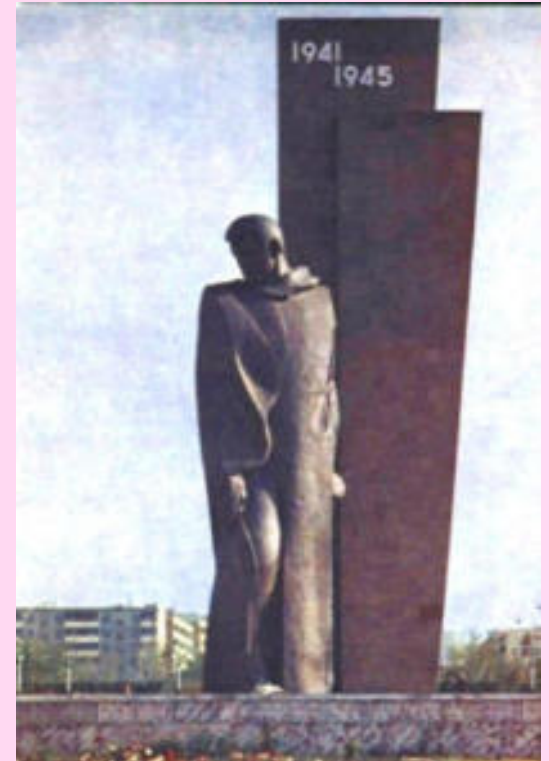
г. Темиртау (Казахстан)