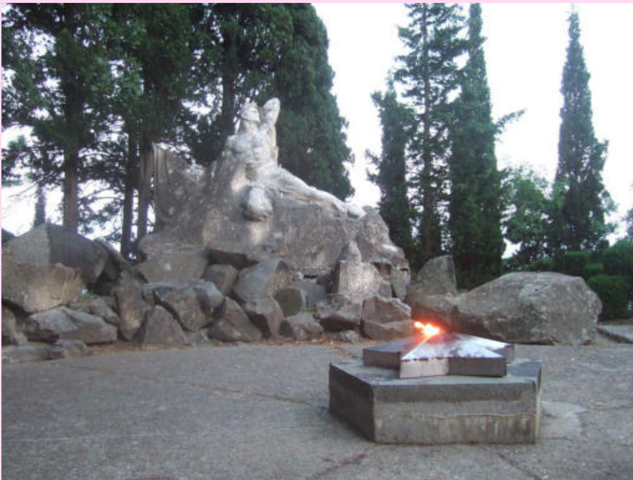
Памятник Неизвестному матросу (Крым, МДЦ «Артек»)

Установлен на могиле матроса, погибшего в 1943 году в бою с фашистами.