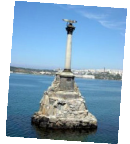
Памятник затопленным кораблям