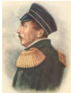
Нахимов П. С., адмирал