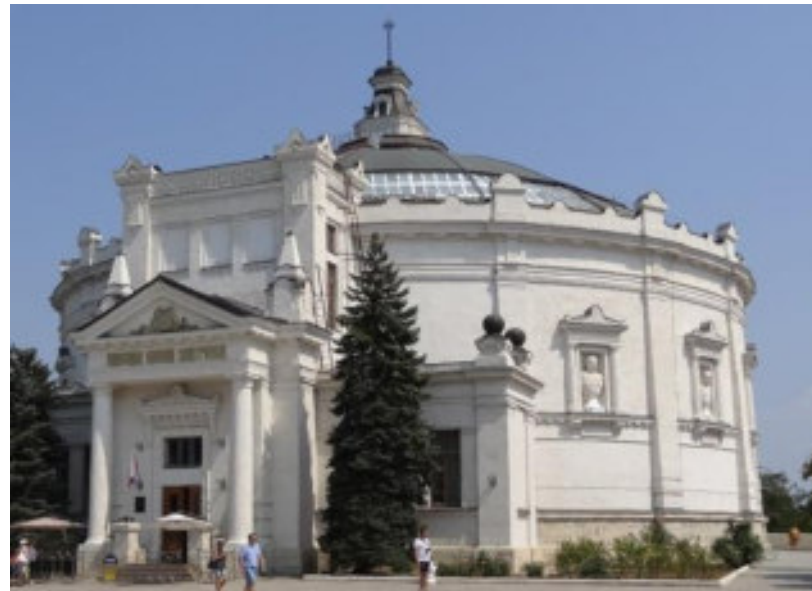
Панорама "Оборона Севастополя 1854–1855 гг."