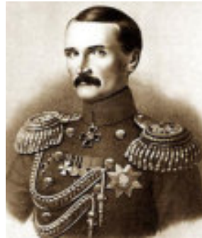
Корнилов В.А., вице-адмирал