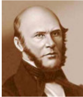
Пирогов Н.И., хирург