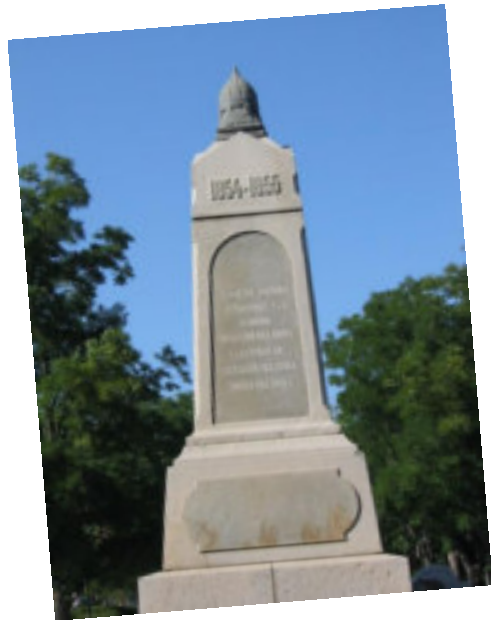
Памятник воинам 4-го бастиона