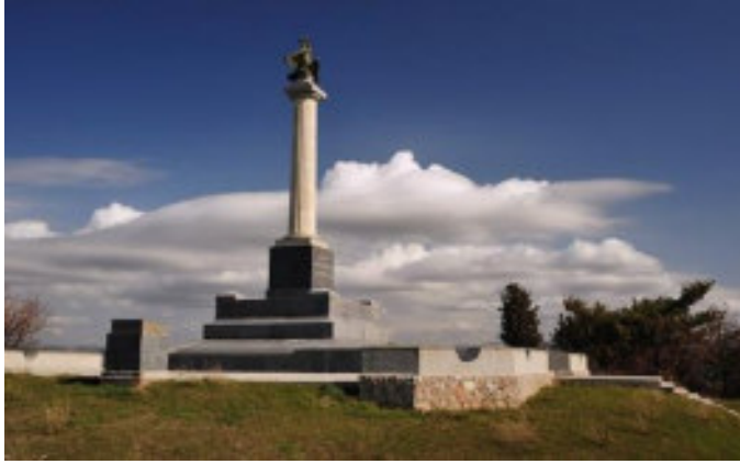
Балаклавское сражение 13 октября 1854 г.

Память о героях обороны Севастополя, воинах, павших в Крымской войне, увековечена в памятниках, обелисках, мемориалах... В 1905 году открыт музей-панорама «Оборона Севастополя 1854–1855 гг.»