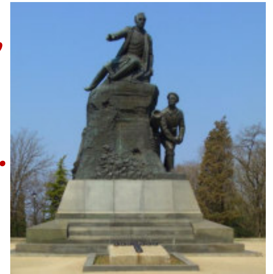
Памятник адмиралу Корнилову