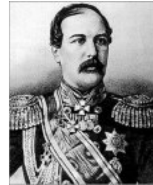
Тотлебен Э.И., военный инженер