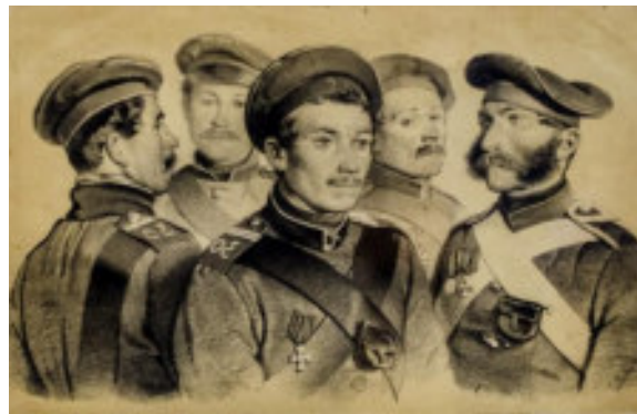
Герои обороны Севастополя