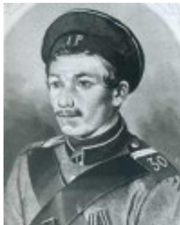
Кошка П., матрос