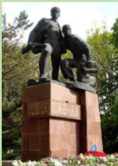
Памятник партизанам и подпольщикам Крыма (г. Симферополь)