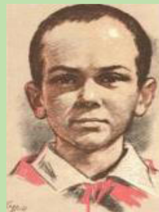
Марат Казей, 14 лет