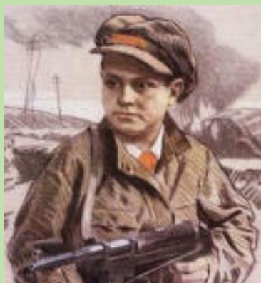
Леня Голиков, 16 лет