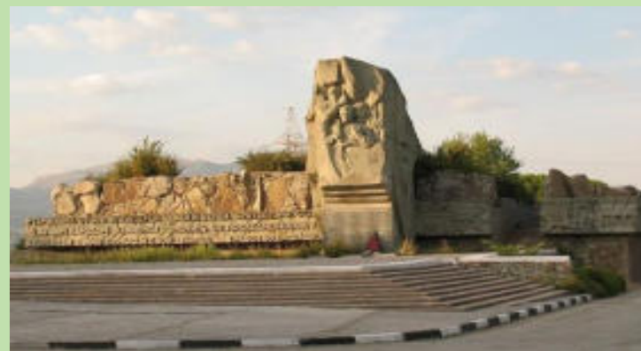
Памятник партизанам Крыма (трасса Алушта – Ялта)