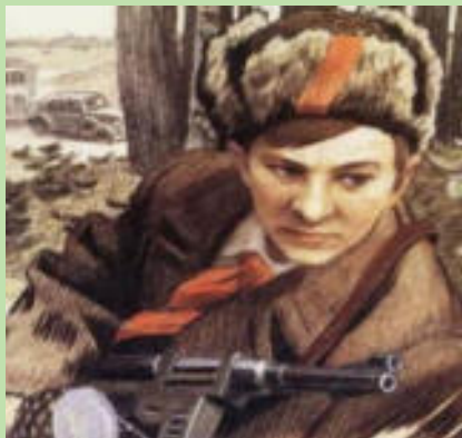
Валя Котик, 14 лет