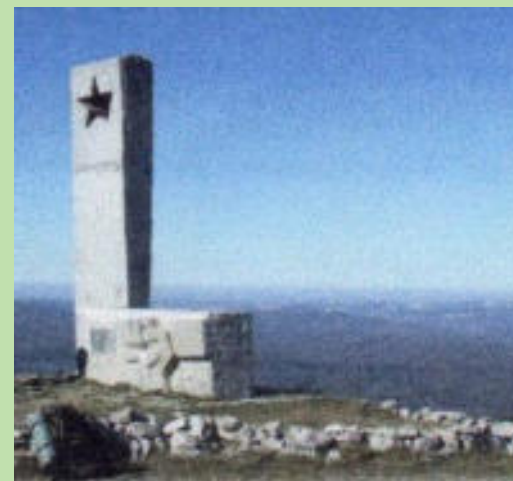
Памятник Ялтинским партизанам (Ай-Петри)