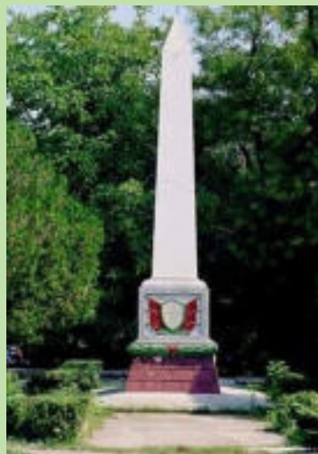
Памятник партизанам (г. Старый Крым)