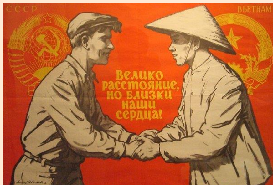
Вьетнамская война (1965–1974)