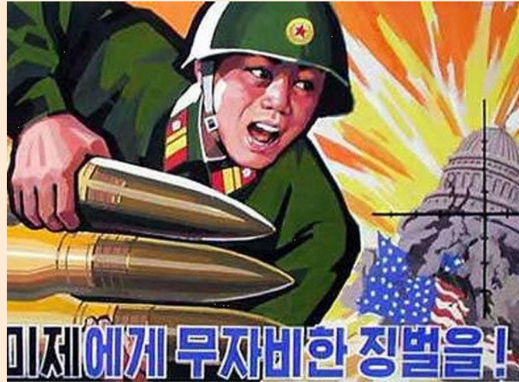
Конфликт на Корейском полуострове (1950–1953)