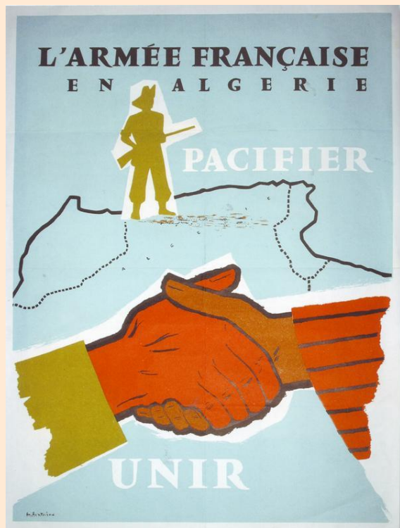
Разминирование территорий Алжира (1962–1964)