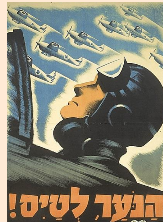
Арабо-израильские войны (1967–1974)