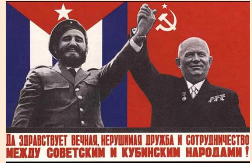
Карибский кризис (1962–1964)