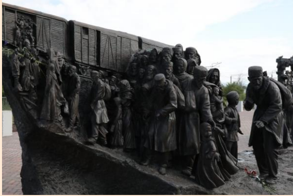
Станция Сирень, Бахчисарайский район