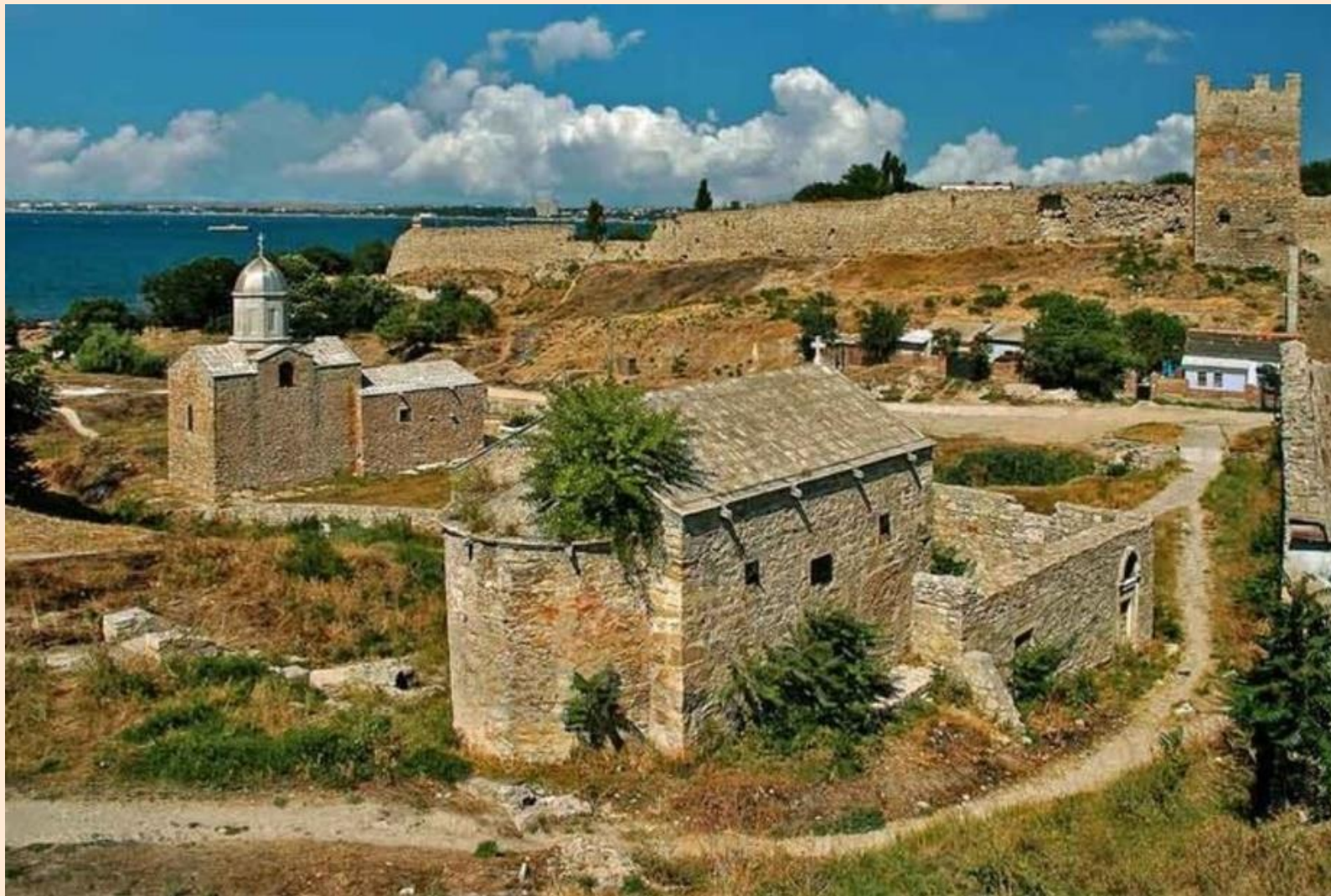
Крепость Айоц-берд (XIII век, Феодосия)