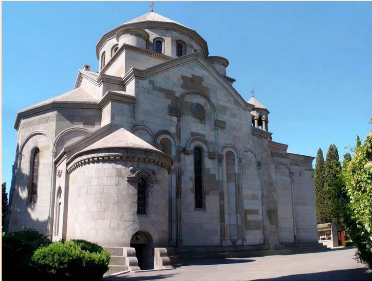
Армянская церковь Св. Рипсиме (Ялта)