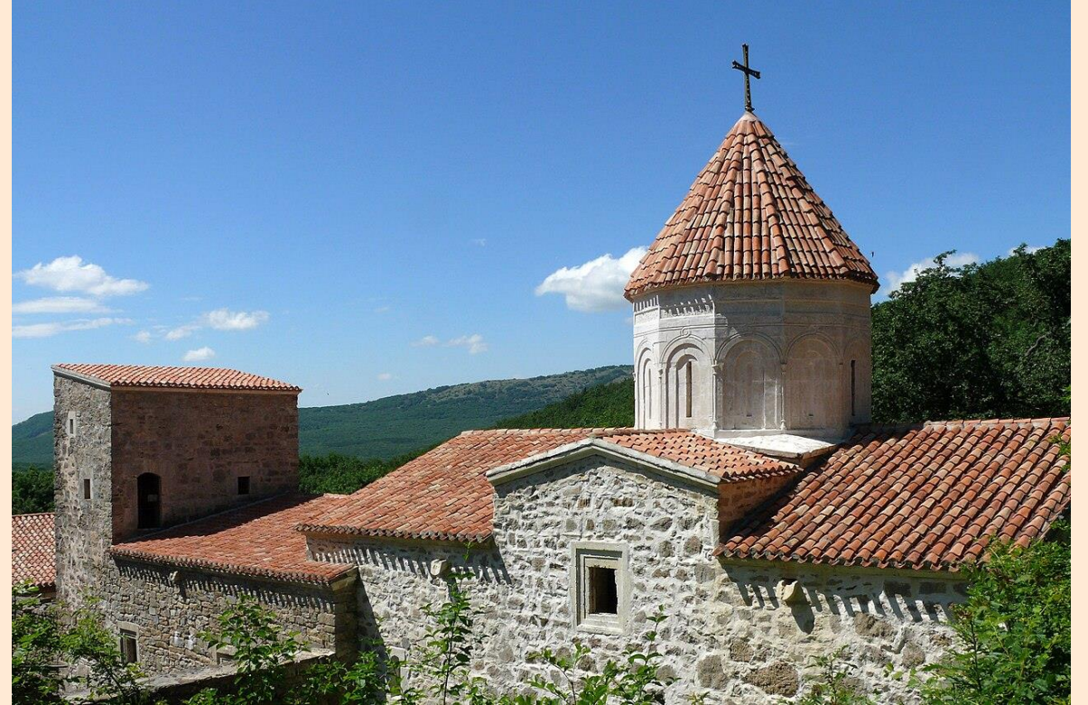
Монастырь Сурб-Хач (XIV век, Старый Крым)